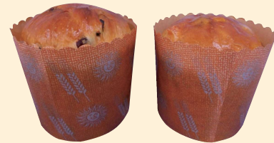
カネカイースト PF 当社従来品