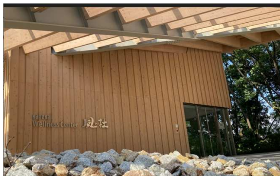
風の杜®エントランス

*1.WELL Building Standard は、International Well Building Institute PBC の登録商標です。