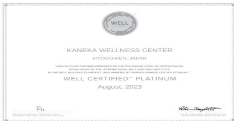
「WELL 認証」 認証書