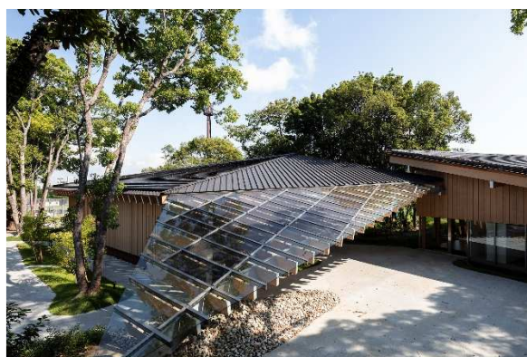
VISOLA®とシースルー太陽光パネルを設置した屋根