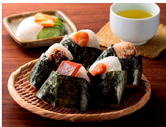
おにぎり（イメージ）

株式会社 JALUX（所在地：東京都港区、代表取締役社長：高濱 悟、以下「JALUX」）と株式会社カネカ（本社：東京都港区、社長：田中 稔、以下「カネカ」）は、 カネカ生分解性バイオポリマー「Green Planet ® 」 （以下 Green Planet）製の食品フィルム包材を、JAL 羽田空港ダイヤモンド・プレミアラウンジで提供されるおにぎりの包材に採用します。食品の個包装に Green Planet 製フィルムを用いる事例としては世界初 *1 となります。